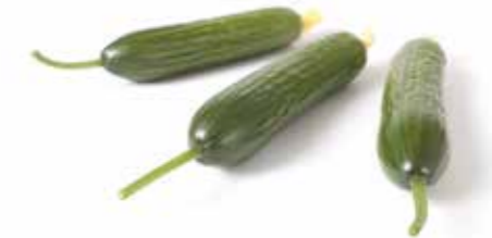
فالكون ستار آر زد

مع انتشار الفيروس يمكن الملاحظة بأن أوراق النباتات التي عندها خاصية الورقة الزرقاء blueleaf تبقى خضراء مقارنة بالأصناف الأخرى بحيث تظهر البقع الصفراء على الأوراق الأخرى .