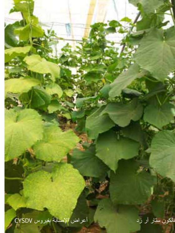
أعراض الإصابة بفيروس CYSDV