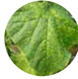
أعراض مرض فيروس إصفرار و تقزم الخيار (CYSDV)